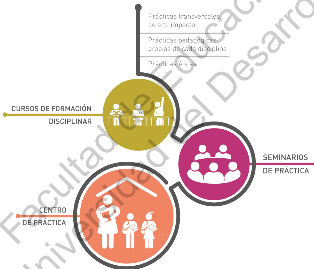
Figura 2: Vinculación entre cursos, seminarios de práctica y experiencia en terreno.