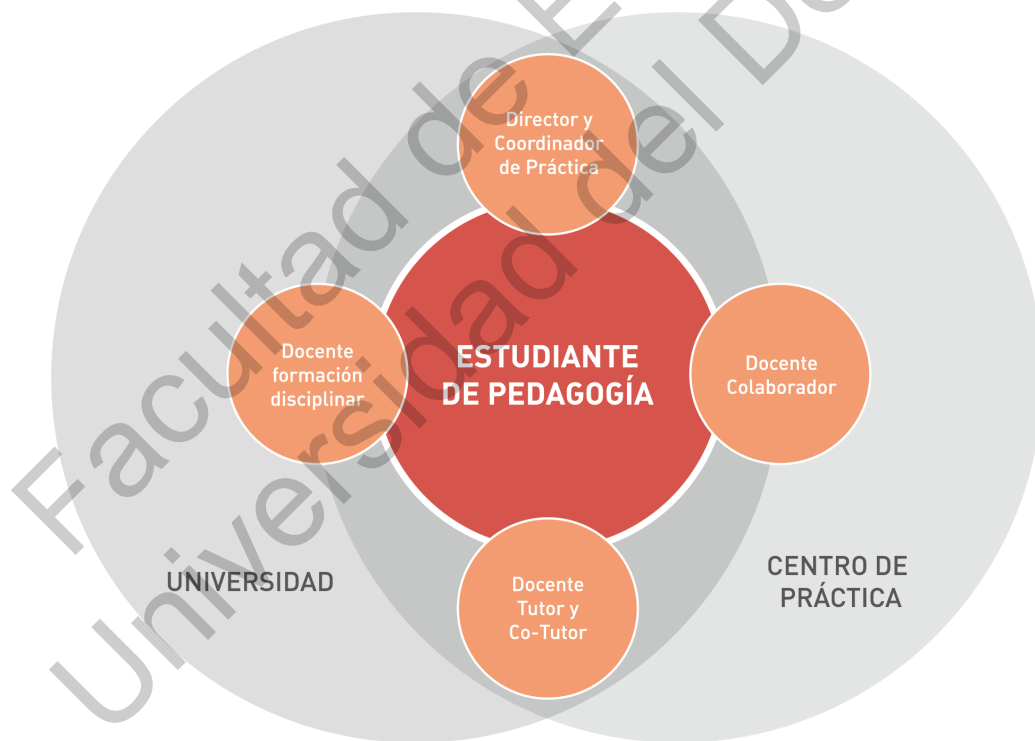
Figura 4: Actores que participan en la Formación Práctica

El Modelo de Formación Práctica de la Facultad de Educación, considera la participación de distintos actores que colaboran en la formación profesional del futuro docente. En el siguiente esquema se ilustran los diferentes actores que intervienen en el proceso.